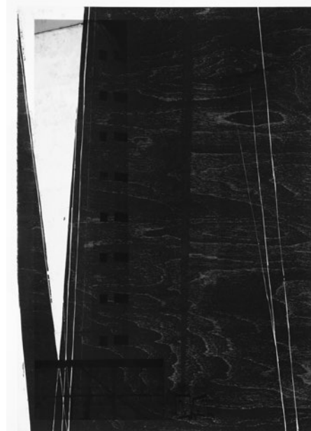
FERNANDO VILELA, SEM TÍTULO, 2012. COLEÇÃO MOMA-NY